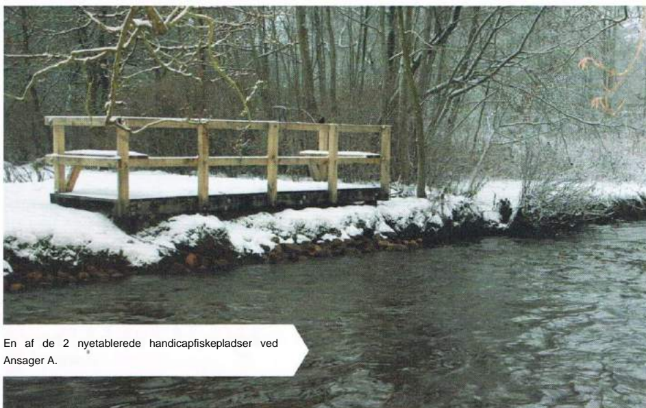
En af de 2 nyetablerede handicapfiskepladser ved Ansager Å.

Der blev i 2010 solgt 197 dagkort til Ansager Å, hvilket er et markant fald på 67 i forhold til 2009: Faldet var godt for fiske